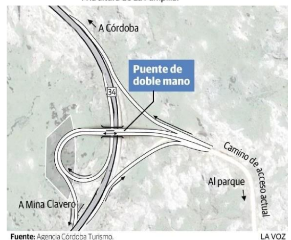
PROYECTO DE ACCESO APROBADO. A la altura de La Pampilla.

Por la ruta circulan ómnibus regulares de línea, de las empresas "COATA" y "ERSA". Estos se pueden tomar en las ciudades de Córdoba Capital, Villa Carlos Paz y Mina Clavero. Comprar boleto a "La Pampilla". En temporada alta, podría ser necesario reservar pasaje con anticipación. Consulte con las empresas.